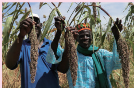
食糧増産のための支援