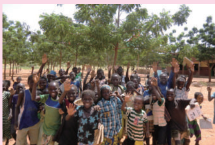
環境回復のための植林活動