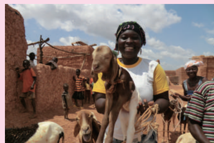
収入（生活）向上のための支援

特定非営利活動法人 緑のサヘル ( http://sahelgreen.org )